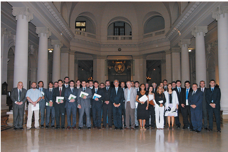
El Centro de Corredores tiene su propio semillero de Noveles Dirigentes “Programa de Formación de Noveles Dirigentes”

Los cien años del Centro de Corredores de Cereales se cumplen en un momento difícil y hasta inédito de la economía mundial, una crisis cuyas consecuencias se harán sentir en el país y en especial en el sector agroindustrial. El corretaje será, una vez más, uno de los puntales que permita superarlas junto al desarrollo del campo argentino.